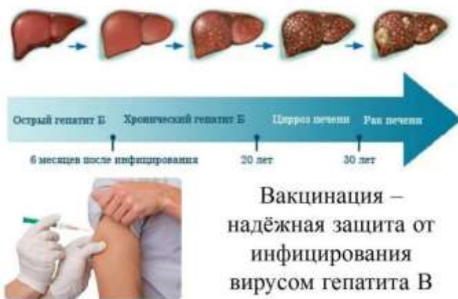
Вакцинация – надёжная защита от инфицирования вирусом гепатита В

Помимо этого, высок риск инфицирования вирусным гепатитом В – тяжелым заболеванием печени. Люди думают, что заразиться их дети не смогут, ведь они воспитываются во вполне благополучной семье, не употребляют наркотики, и с кровью нигде не пересекаются. Это опасное заблуждение. Дети, заразившиеся гепатитом, практически всегда становятся хроническими больными, что приводит к серьезным отдаленным осложнениям в виде цирроза и рака печени. Все это ведет к инвалидности и ранней смертности.